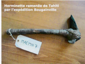
Herminette ramenée de Tahiti par l'expédition Bougainville