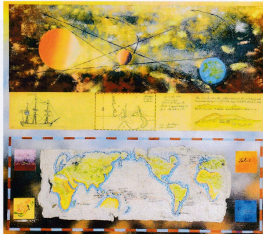
"Louis-Antoine de Bougainville" par Roger-Henri

Pour évoquer cette vie longue et bien remplie nous avons édité des panneaux avec gravures et textes écrits conjointement par Pierre Bérard et Henri Colombié. Le voyage sera particulièrement bien illustré avec l'apport d'objets océaniques prêtés par différents musées : musée d'Aquitaine à Bordeaux, musée d'Angoulême, musée de la marine de Rochefort, par la présence d'animaux naturalisés que nous a confiés le muséum d'histoire naturelle de Montauban ainsi que par des coquillages ou encore des documents comme le manuscrit détenu par la Société de géographie de Rochefort, œuvre du chirurgien-major Vivez, membre de l'expédition. Seront aussi évoquées en parallèle les histoires du botaniste Commerson et de son curieux domestique ou encore du Tahitien Aoutourou ramené par Bougainville.